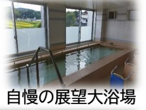
自慢の展望大浴場

入居者様の暮らしに関する相談事やお一人おひとりに合わせた介護サービスをご提案し、快適な暮らしのサポートをいたします 出来るだけ、自立したお一人暮らしが続けられるようにお手伝いをします