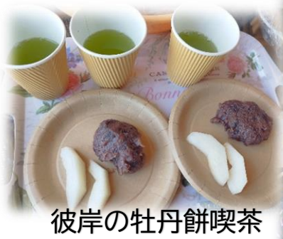
彼岸の牡丹餅喫茶

日本ならではの季節の食べ物を皆様に提供し、昔を懐かしんでいただいています出来るだけ手作りにこだわっています 挽きたて珈琲と煎茶でおもてなし